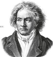
L. van Beethoven

Comme dans l'exercice 1a : jouer un sol en tirant (joli son !). S'arrêter ; jouer un deuxième sol, en poussant (v), sur une petite distance. Baisser le bras droit. Pendant tout l'exercice : écouter ! Recommencer plusieurs fois, tranquillement, de mieux en mieux.